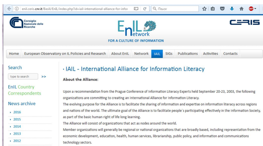
Рисунок 1 – Сайт з інформацією по Міжнародному альянсу з інформаційної грамотності

На конференції з інформаційної грамотності у Празі (the Prague Conference of Information Literacy Experts), яка відбулася 20-23 вересня 2003 року, було вирішено організувати Міжнародний альянс з інформаційної грамотності (International Alliance for Information Literacy, рис. 1). Альянс визначає інформаційну грамотність як здатність ідентифікувати потребу в інформації, виявляти, знаходити, аналізувати, оцінювати та ефективно використовувати інформацію для розв'язання певних питань та проблем. Отже, інформаційну грамотність вважають основною компетенцією особистості, яка є необхідною для постійного вдосконалення професійної компетентності [2].