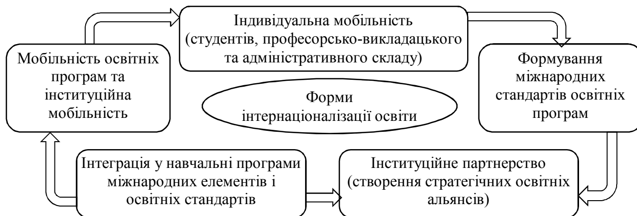
Рисунок 2 – Форми інтернаціоналізації вищої освіти (розроблено автором на основі джерела [2])

До інтернаціоналізації вищої освіти відносять форми міжнародного співробітництва, наведені на рис. 2.