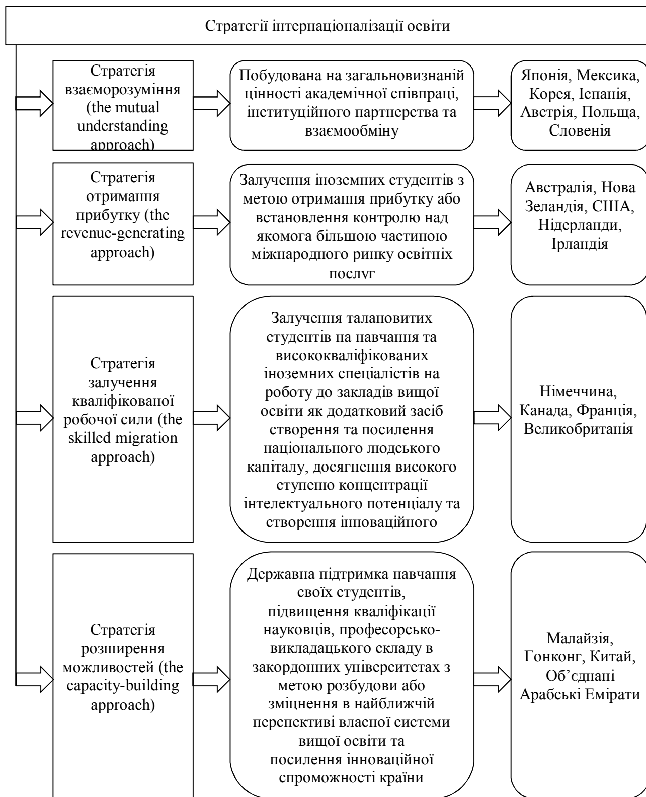
Рисунок 3 – Стратегії інтернаціоналізації вищої освіти (розроблено автором на основі джерела [4])

Як видно з рис. 3, виділено чотири основні стратегії інтернаціоналізації вищої освіти, реалізація яких сприятиме вирішенню питання дисбалансу кредитної і ступеневої мобільності та інституційного співробітництва, сприяти співробітництву вищої освіти і