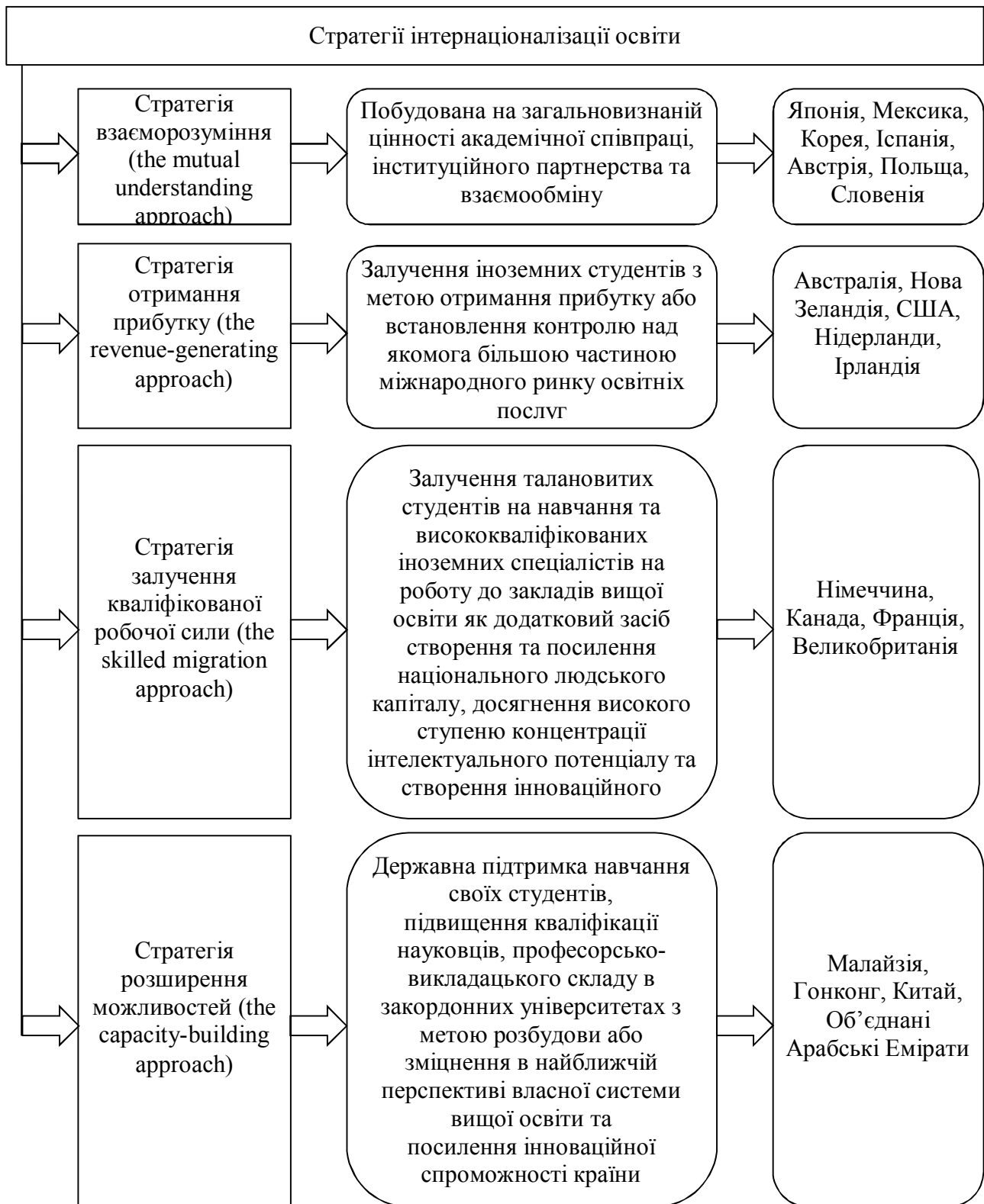
Рисунок 3 – Стратегії інтернаціоналізації вищої освіти (розроблено автором на основі джерела [4])

Як видно з рис. 3, виділено чотири основні стратегії інтернаціоналізації вищої освіти, реалізація яких сприятиме вирішенню питання дисбалансу кредитної і ступеневої мобільності та інституційного співробітництва, сприяти співробітництву вищої освіти і