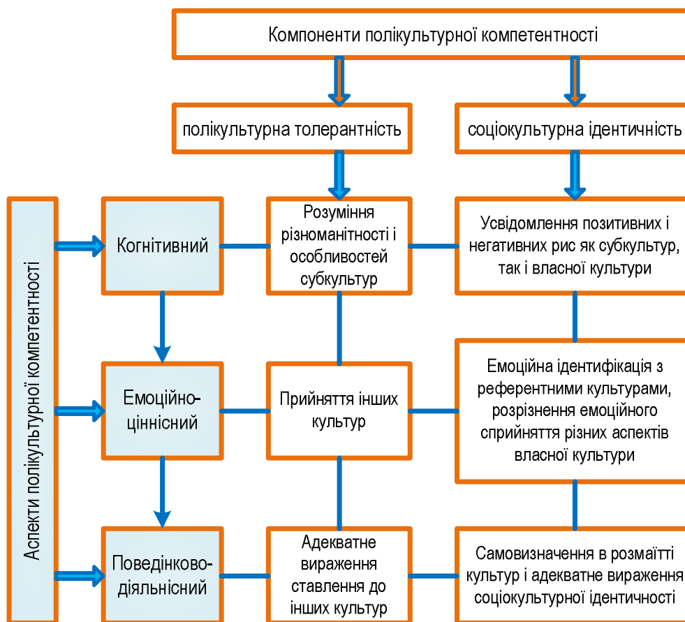
Рис. 2. Складові полікультурної компетентності

когнітивному, емоційно-ціннісному та поведінково-діяльнісному аспектах, що схематично зображено на рис. 2.