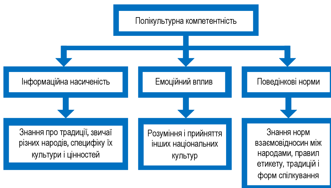
Рис. 1. Напрями формування полікультурної компетентності