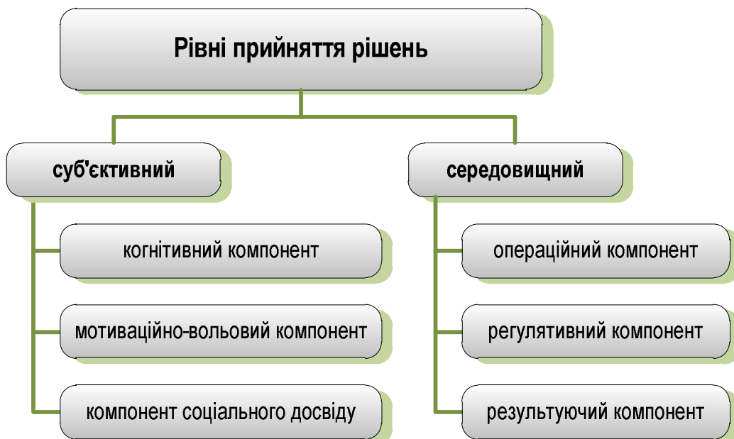
Рис. 2. Рівні прийняття рішень

Прийняття рішення формується, проявляється і реалізується на двох основних рівнях, що схематично зображені на рис. 2.