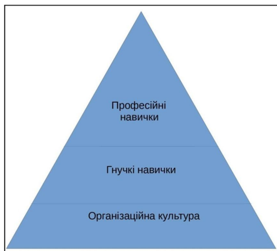
Рис. 1. Середовище формування гнучких навичок

діяльності. Отже, таким чином відбувається процес формування професійних навичок, а моделюючи ситуації, наближені до реального життя, студенти розвивають і власні гнучкі навички. (рис. 1).