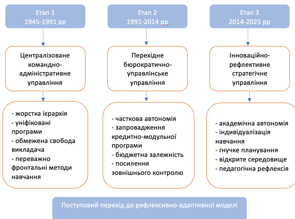
Рис. 2. Модель трансформації управління в УжНУ (1945–2025) (створено автором)

Таким чином, УжНУ підтверджує актуальність застосування моделі рефлексивного управління освітнім процесом у вищій школі, де акцент зміщується: з директивного контролю – на відкритий діалог; з ієрархічного керівництва – на колективну взаємодію; з нормативної жорсткості – на адаптивну гнучкість; з репродуктивного адміністрування – на інноваційне проєктування освітньої діяльності (рис. 2).